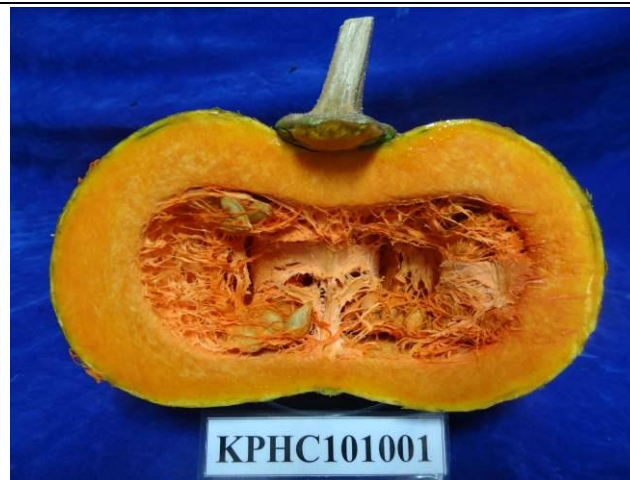
圖 2. 南瓜 '高雄 1 號-菊島之華' 果實縱剖面。